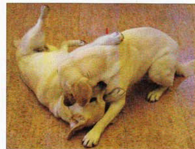
Nach ihrem Einsatz spielen die Therapiehunde Aischa und Meti ausgelassen miteinander.

hohe Anforderungen an die Hygiene», sagt Peggy Hug. So schreibt der Verein Therapiehunde Schweiz eine jährliche Untersuchung durch den Tierarzt und die regelmässige Entwurmung des Hundes vor. Tiergestützte Therapien eignen sich für viele Kinder