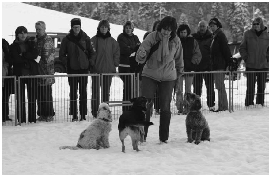
Die Teilnehmer des Weiterbildungs-Seminars sind aufgefordert, das Spiel der Hunde genau zu beobachten, um die Absichten und Gefühlslagen der einzelnen Tiere erkennen zu können.

Therapiehunde steigern die Lebensqualität benachteiligter Menschen beachtlich. Sie leisten als Türöffner zur Seele des Menschen unschätzbare Dienste. In ihrer Arbeit sind sie aber stets als Therapeutikum einzusetzen und dürfen nicht als Therapeut missverstanden werden. Sie sind Teil