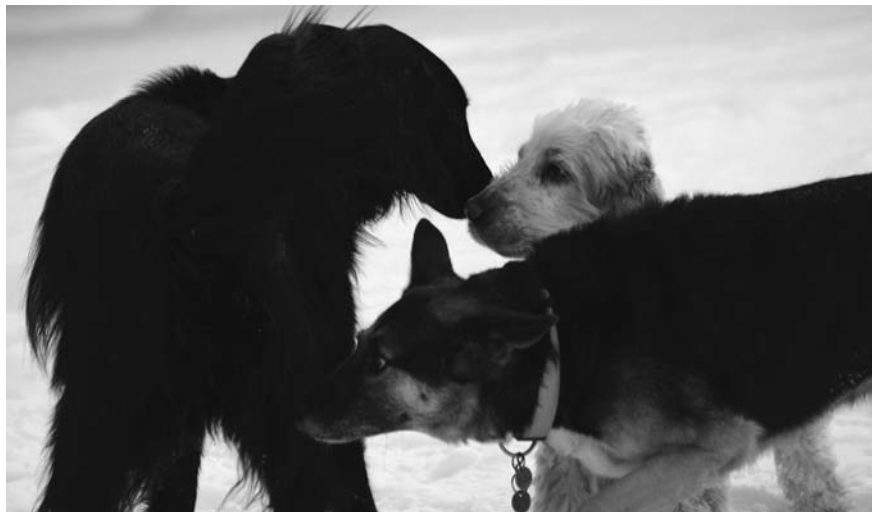
Die Flat Coated Retriever-Hündin, die alleine auf ein Rudel von drei Hunden trifft, zeigt deutliche Anzeichen von Stress. Ihre Nackenhaare sind gestäubt und ihre Bewegungsabläufe sind sehr angespannt.

einander frei spielen. Ein Rudel von drei Hunden trifft auf eine einzelne, ihnen unbekannt Hündin. Für sie ist diese Situation mit viel Stress verbunden, den sie durch gestellte Nackenhaare und eine Anspannung im ganzen Körper deutlich macht. Diese Anzeichen muss der Hundehalter erkennen können. Dieser einzelne Hund fühlt sich unsicher und ist auf die Hilfe und Unterstützung des Menschen angewiesen. Die Halter von Therapiehunden sind aufgerufen, ihre Hunde auch im Einsatz jederzeit gut zu beobachten, deren Anzeichen von Stress rechtzeitig zu erkennen und sie aus einer Situation, die dem Hund zuviel wird, herauszunehmen.