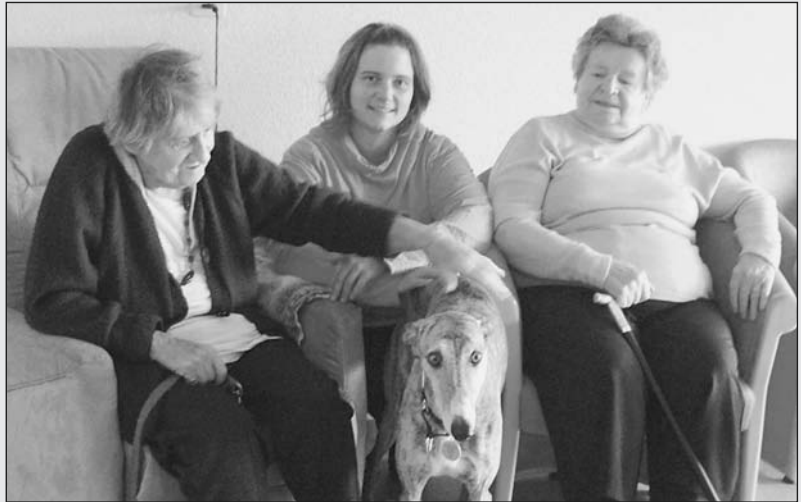
Die Heimbewohner freuen sich über den tierischen Besuch.